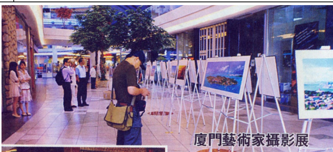
廈門藝術家攝影展